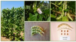
Fagiolo Zallinedda Ollolai galleria