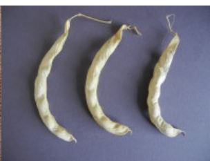
Acc. 152 - 5 Baccelli secchi