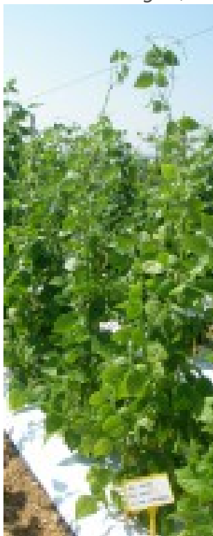
Acc. 152 - 1 Pianta