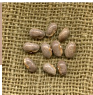
Acc. 152 - 7 Semi