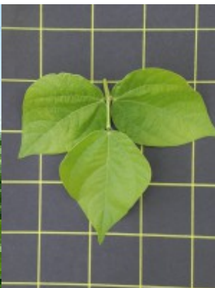
Acc. 152 - 2 Foglia