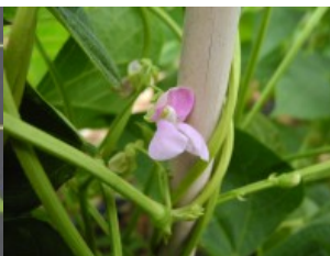
Acc. 152 - 3 Fiore