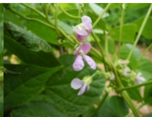
Acc. 152 - 3a Fiore