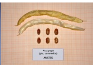
Acc. 152 - 6 Baccello e semi