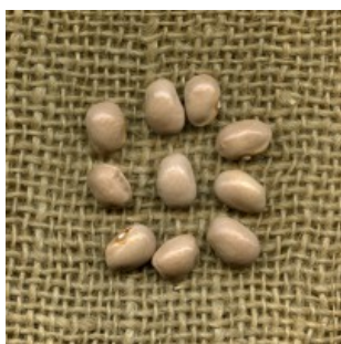
Acc. 152 - 8 Semi (variante)