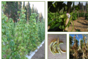
Pisu de linna Lanusei acc 42 GALLERIA