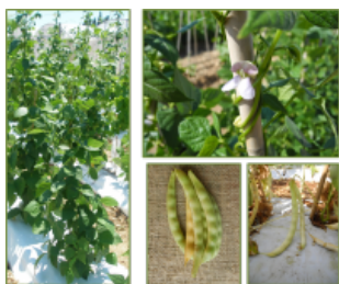
Pisu biancu acc 31 GALLERIA