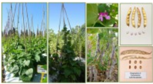
Fagiolo Giogheda di Castelsardo galleria