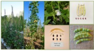
Fagiolo Fazadu ruju Pattada galleria