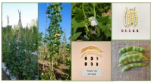
Fagiolo Fazadu ruju Pattada galleria