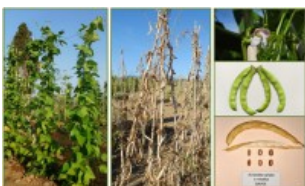
Fagiolo Avisedda grigio o